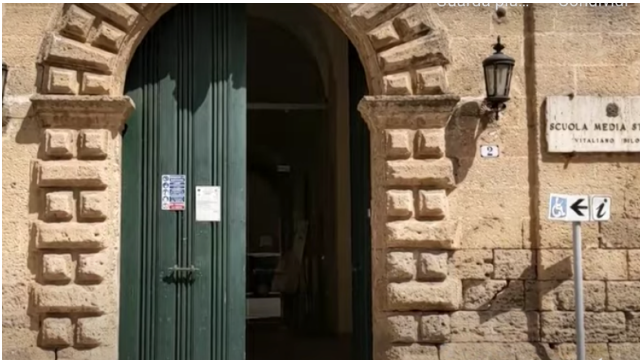
L'ingresso della storica scuola